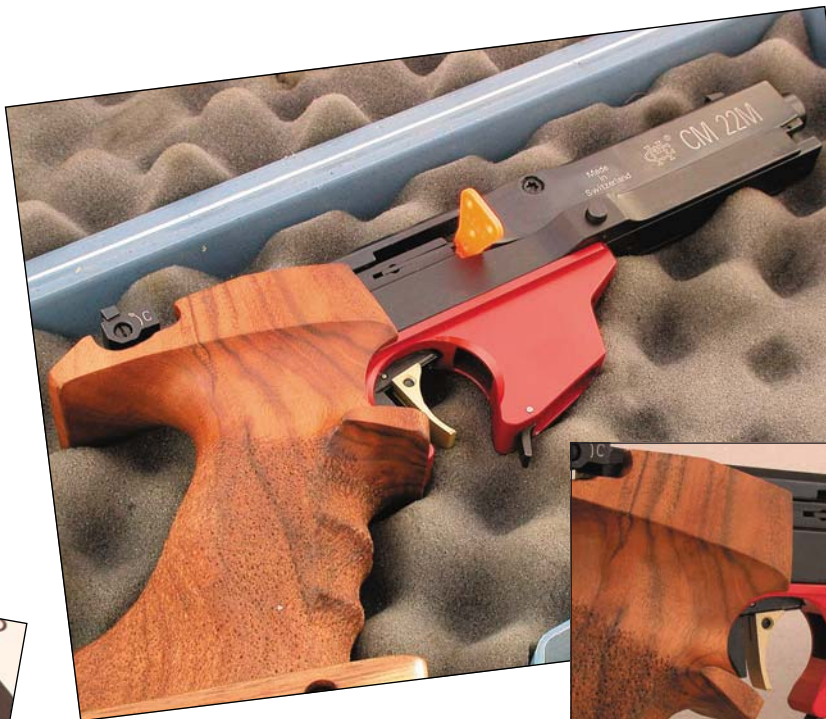
Exempel på proppad Morini CM22M i väska (går att stänga med propp i).