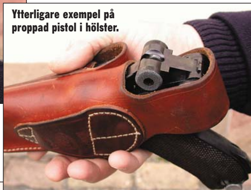
Ytterligare exempel på proppad pistol i hölster.