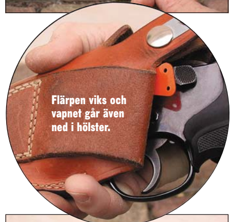
Flärpen viks och vapnet går även ned i hölster.